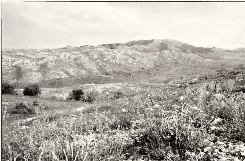
Fig. 5. Locality Asandura.

1938: 127); Ohrid (Silbernagel 1944); Ohrid, 10.–20.06.1954 ( Zerynthia cerisyi ferdinandi Stichel, Michieli 1963: 17); Galičica Mt., Dren; Ohrid, 05.05.1982 (as Allancastria cerisyi ferdinandi Stichel, Thurner 1964: 18); Galičica Mt. (Jakšić 1988: 43); Ohrid, 05.05.1982 (as Allancastria cerisyi God., Scheider & Jakšić 1989: Taf. 4, fig. 4). SKO: Ohrid, 25.05.1918; Ohrid, 02.06.1936, Silbernagel.